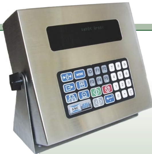
Rys. 1. Procesor wagowy GSE661

Firma Wikpol Sp. z o.o. jako autoryzowany przedstawiciel amerykańskiej firmy GSE Scale Systems, oferuje nowoczesne, swobodnie programowalne procesory wagowe, które są uniwersalnymi przyrządami stosowanymi w automatyzacji systemów pomiarów masy i układów sterowania.