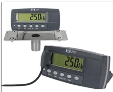
Rys. 4. Miernik GSE250

Firma GSE Scale Systems ma w swojej ofercie również mierniki GSE250 i GSE255 (bez możliwości programowania), idealne do aplikacji typu: ważenie zbiorników, precyzyjne ważenie na wagach platformowych czy podłogowych.