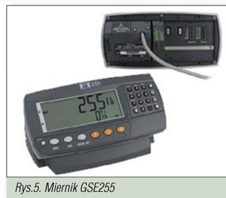
Rys.5. Miernik GSE255

mocą w doborze, konfiguracji, programowaniu, parametryzacji i skalowaniu mierników. Zapewniają także skuteczny serwis i diagnostykę. Firma Wikpol świadczy również usługi w zakresie projektowania wszelkich aplikacji w oparciu o wszystkie typy mierników firmy GSE Scale Systems.