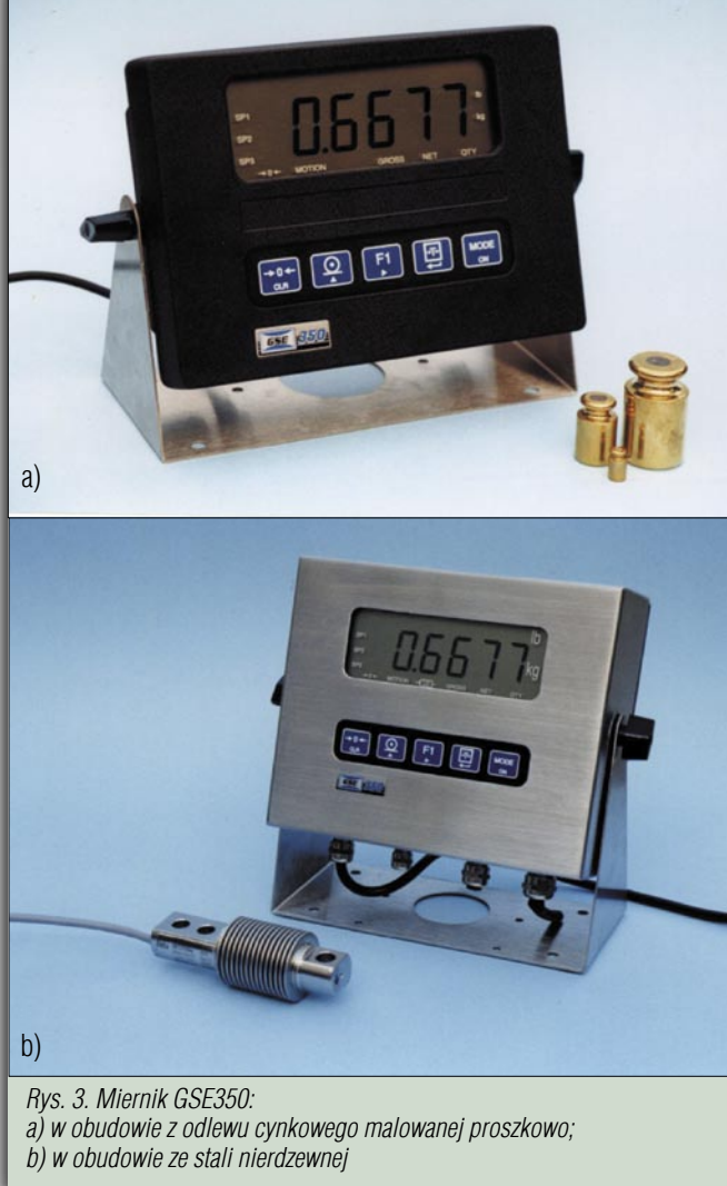
Rys. 3. Miernik GSE350: a) w obudowie z odlewu cynkowego malowanej proszkowo; b) w obudowie ze stali nierdzewnej

Pracownicy firmy Wikpol dzięki posiadanej wiedzy i szkoleniom w firmie GSE służą po-